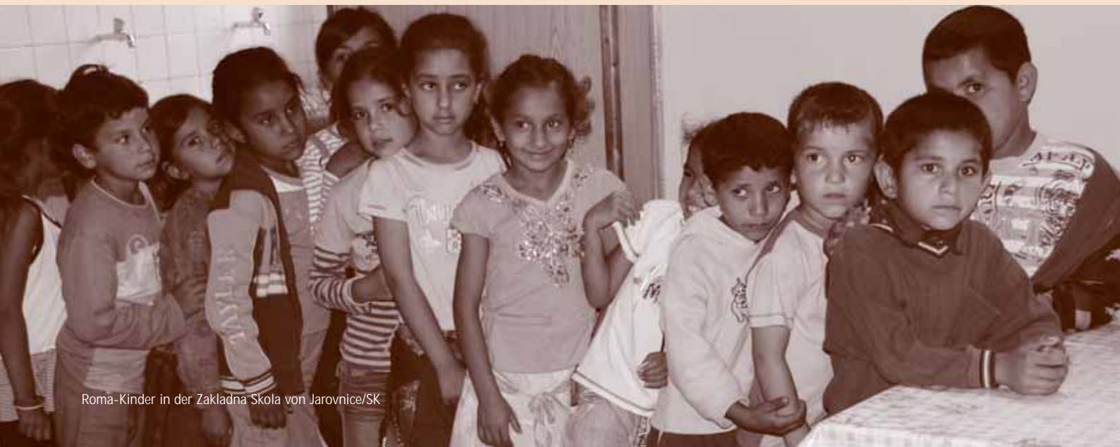
Roma-Kinder in der Základná Skola von Jarovnice/SK

Ein wunderbares Geburtstags- und Weihnachtsgeschenk haben uns die Druckerei Europrint und die Agentur Rabold Kaufmann und Co. (Layout) gemacht: Sie haben ermöglicht, mehr Zeitung ohne Mehrkosten herauszubringen. Redaktion und Verein bedanken sich auf diesem Wege recht herzlich für das Entgegenkommen und die langjährige gute Zusammenarbeit. Wir wünschen den beiden Firmen und ihren Mitarbeitern ein frohes Weihnachtsfest und ein gutes und erfolgreiches Geschäftsjahr 2010.