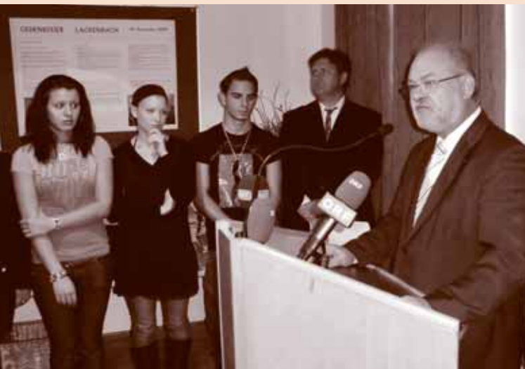
LAvg. biro Gerhard Pongracz uso jubilejumiskero mulatintschago LAvg. Bgm. Gerhard Pongracz bei der Jubiläumsfeier

Auch wenn noch genug zu tun bleibt, die Bilanz des Verein Roma anlässlich des Geburtstagsfestes am 26. November fällt positiv aus. Beratungsstelle, außerschulische Lernbetreuung, Veranstaltungen, Initiativen und Publikationen, das sind Errungenschaften, die heute nicht mehr wegzudenken sind.