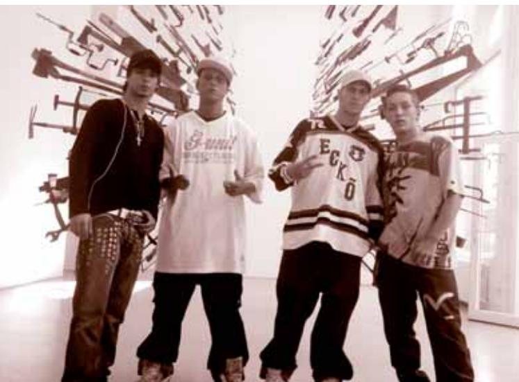
I Backspinna Crew ando Berlin Die Backspinna Crew in Berlin

audijenca phentscha lake, hot ando septemberi kulturakere divesa le Romenge kerde on. Amen dikaha so ovla. O than maschkar Theiß taj Prut hi o than le Romendar andi Europa. Nikaj na del Roma ande ada feschtinipe taj mindenfelitikipe, usar o harkumaschengere tradime Kalderas dschi uso kaschteskere schnicerinipeskere Rudari, tschak hot on adala butatar adi on te dschil buter na dschanen. Phuro srasta khetan te kedel, sar le o dschene le schtromiskere genaschiha keren, hi adi i lek buteder buti le Romendar. O loj save ande len tschule hi sar o socijalakero pomoschago, savo 20 lei andi masek ar keren. Ada menik 7 euro hi. Taj sar mindig o dschene adal flogoskera grupnatar pumen den, le avre niposke na keren nisaj voja, terdschon on fi i tschori, phuri Rumenija. Ando nevo, upre terdschajipeskero, upre blijananipeskero dschivipe ardit-schol, hot le manuschen la kala cipaha taj le unortodoksi dschivipeha nisaj than nan. Kada me ando bus la numeraha 8 jeka phura dschuvlake tschinde mujeha taj pre enkeliha upri rik mro than dav taj man pasche terdscharav, erschtival schitikne dikel taj akor afka tel pe bescharel, hot nisaj tschatschipe la hi taj te nisaj voja, o than jek gadschestar ande te lel. Andi söbi cajt telal o avre ando bus jek keverinipe andar na latscho vodschi taj tel dikipe pe bulharel. „Saj dilino hi ada, soske la Zigeunerinake o than mukel?“ genav ande lengere muja.