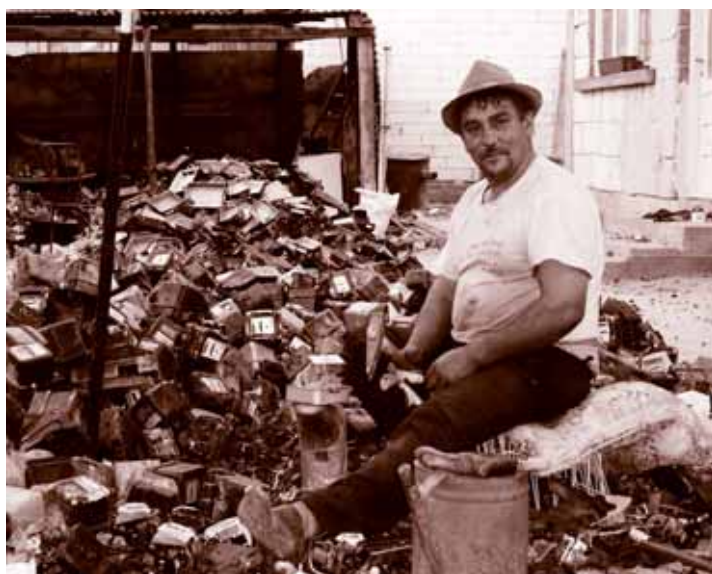
Rom uso phageripe le schtromiskere genaschistar Rom beim Zerlegen von Stromzählern

Ando juni sina jek grupn 23 dschenendar andar o Burgenland, i Telutni Austrija taj Betschistar trin divesa dur kher rodaschtscha ando europitiko kulturakero scheroskero foro 2007 Sibiu / Hermannstadt, o aguno gondengero taj adivesekero virtschoftakero centrum Siebenbürgenistar. I roas la flogoskera utscha ischkolatar le burgenlanditike Romendar organisirim uli. Centrali falato le kher rodipeskere programistar sina jek talalinipe rumentitike Romenca.