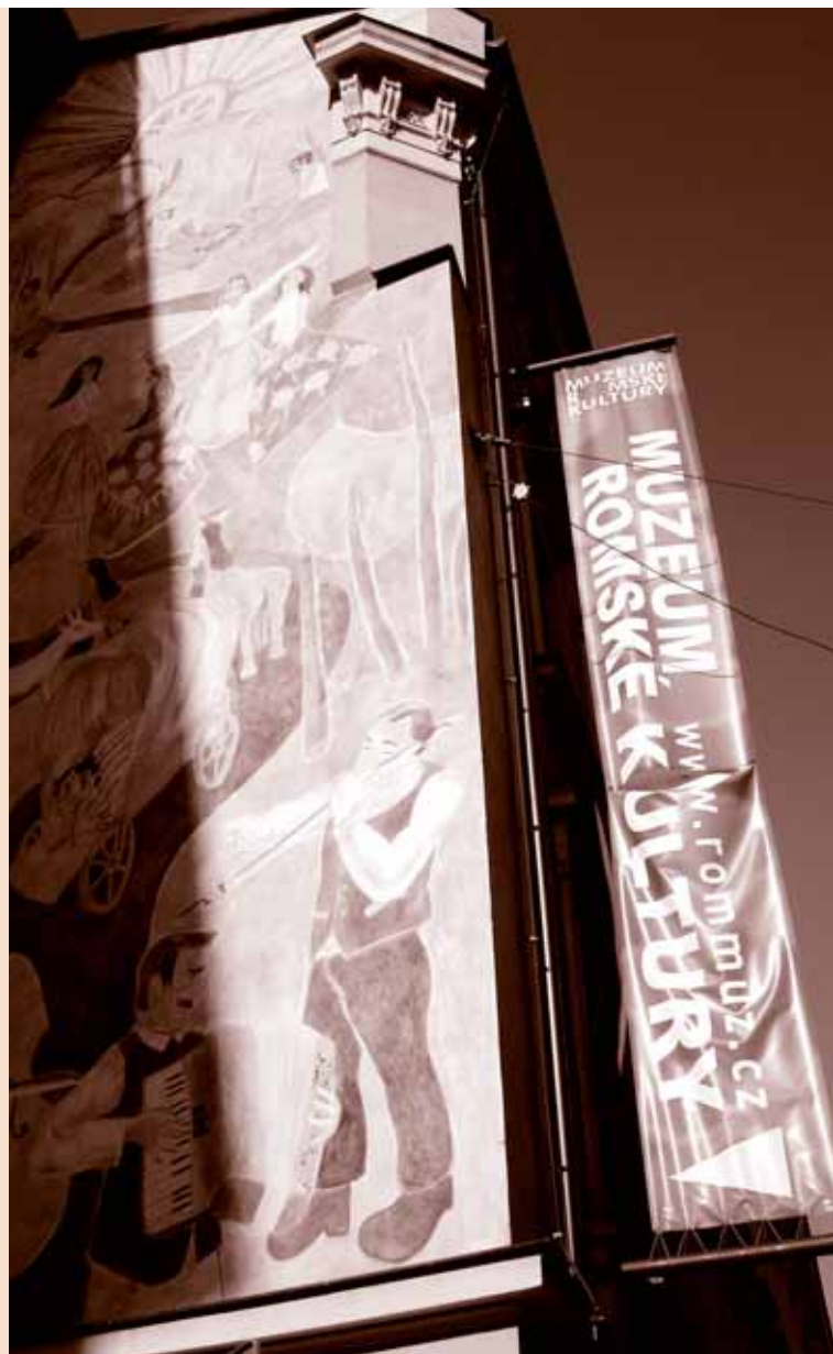
Avrutno aundikipe le museumistar andi Bratislavka Ulica Außenansicht des Museums in der Bratislavka Ulica