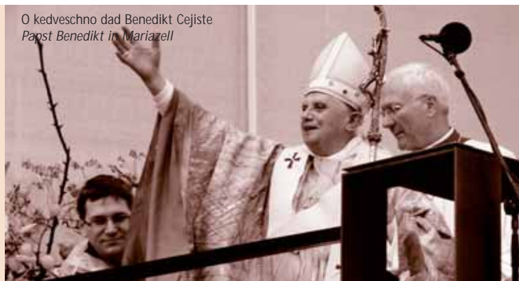
O kedveschno dad Benedikt Cejste Papst Benedikt in Mariazell