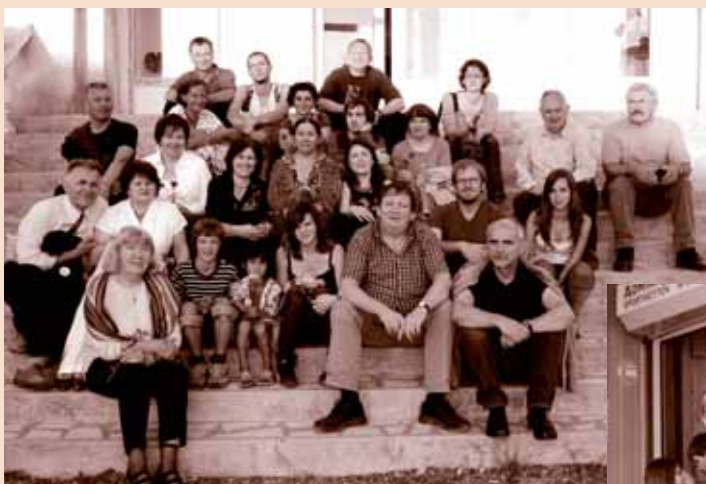
Roasinipeskeri grupn ando Sibiu Reisegruppe in Sibiu