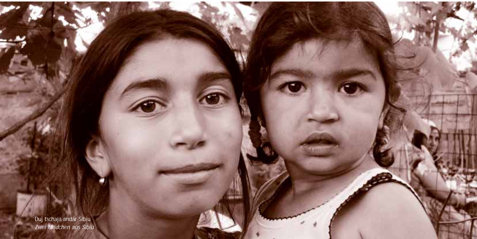
Duj tschaja andar Sibiu Zwei Mädchen aus Sibiu