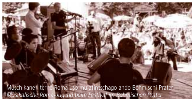
Muschikane terne Roma uso mulatintschago ando Böhmischi Prateri Musikalische Roma-Jugend beim Festival im Böhmischen Prater

O ada berscheskero gondolipeskero mulatintschago uso gondolipe upre odola Roma, save ando Lackenbach ande tschapim taj andar Lackenbach bejg ledschim taj murdarde ule, hi suboton, 17. novemberi (11.00 orange). O Farajan Roma papal jek bus organisirinel. Fi o ladipe schaj tumen uso Farajn Erbate aun meldinen.