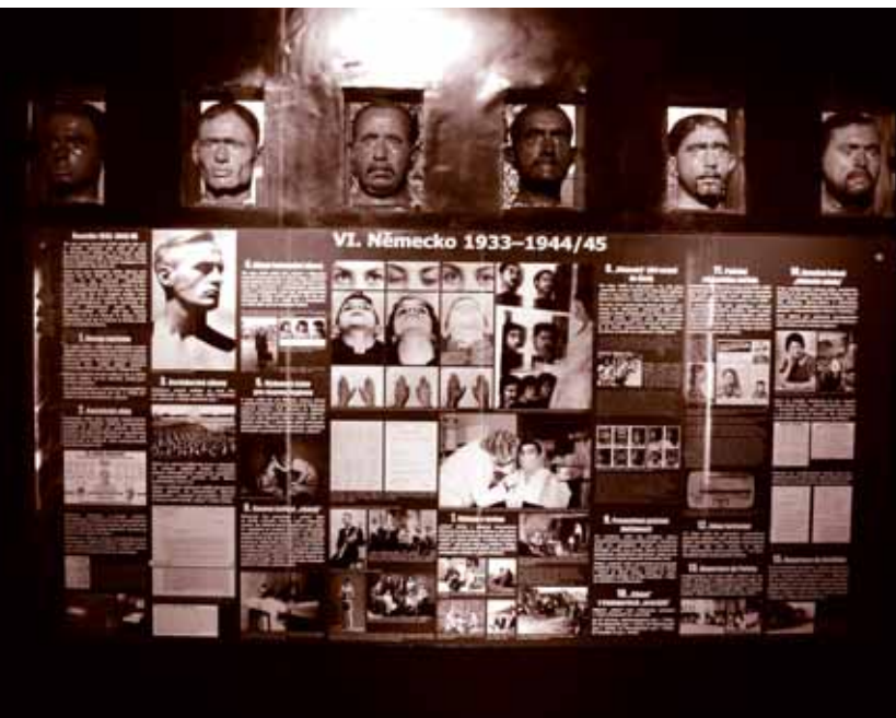
Artschijipe savo mindig hi pedar o holocaust BildtextStändige Ausstellung über den Holocaust