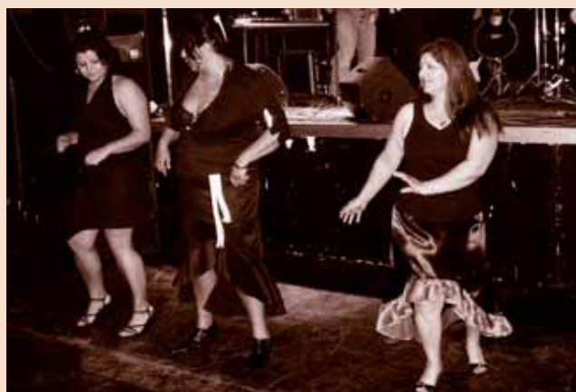
Khelipeskero sikajipe upro Roma Butschu - dschuvla le projektistar „Mri Buti“ Tanzeinlage am Roma-Butschu - Frauen des Projekts „Mri Buti“

Großes Interesse rief die Ausstellung der Kinder und Jugendlichen unseres Projekts „Außerschulische Lernbetreuung“ hervor. Sie stellten die im heurigen freizeitpädagogischen Sommerprogramm angefertigten Bilder unter dem Motto „Pablo Picasso“ zur Schau. Dabei haben sich die Kinder mit der Kunst Pablo Picassos auseinandergesetzt und versucht wie er zu malen und zu denken. Daneben wurden auch selbstangefertigte Köpfe aus