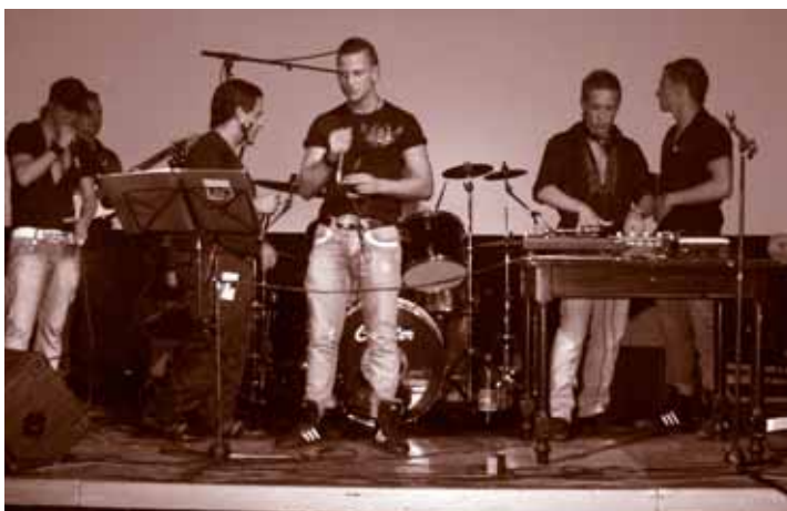
Backspinna Crew presentirinel pri jerinipeskeri dschili upro Roma Butschu Backspinna Crew präsentiert ihren Siegersong am Roma-Butschu

Upro phutschajipe sikavas la amen meresch te upre avre thana taj ande avre institucijontscha.