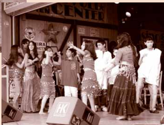
Romengero mulatintschago Betschiste Romafest in Wien