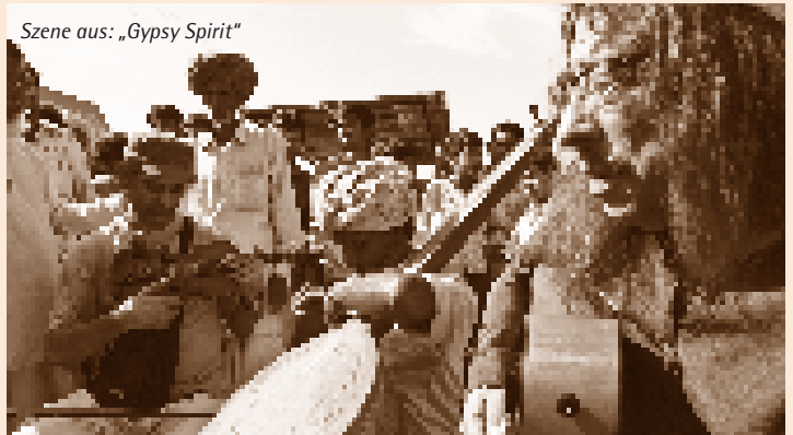
Szene aus: „Gypsy Spirit“

Später kommt es zum Showdown in Wien. Die Inder spielen mit Harri und Co und zeigen was sie auf der einseitigen Bhang und auf der Maultrommel drauf haben. Gypsy Spirit lebt von köstlichen Kontrasten, einem musikalischen Schnitt und last but not least von Stojkas konsequenter urwienerischer Selbstironie, schrieb Samir H. Köck am 5. September in der Zeitung Die Presse.